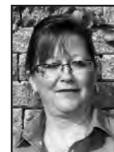
Line St-Georges Secrétaire